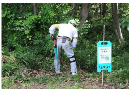
7/21 千畳敷北・腰曲輪の作業