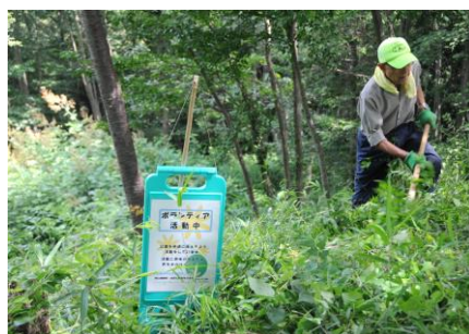
7/21 千畳敷北・腰曲輪の作業