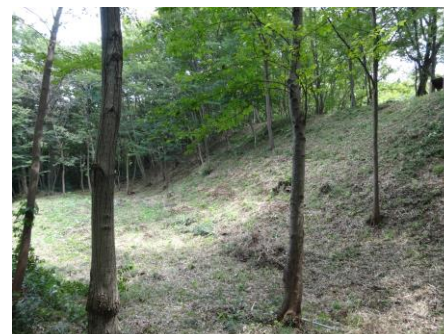
8/18 作業後の千線畳敷北・腰曲輪 (7/21とほぼ同じ位置から撮影)