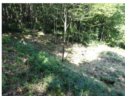
8/18 千線畳敷北・腰曲輪(作業前)