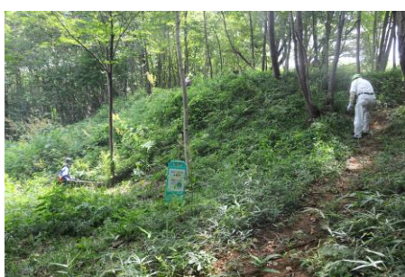
7/21 千畳敷北・腰曲輪の作業