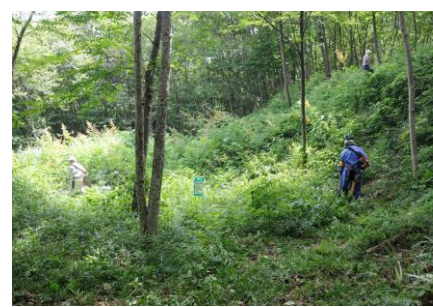
7/21 千畳敷北・腰曲輪の作業