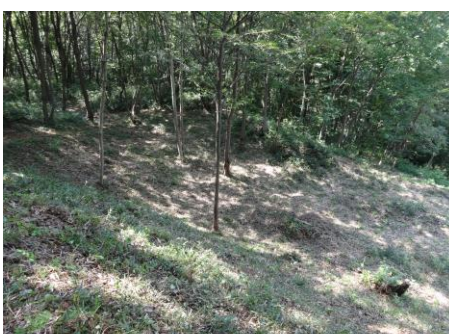
8/18 千線畳敷北・腰曲輪(作業後)