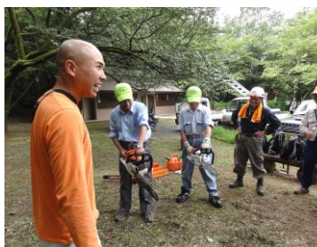
正しい持ち方の講習