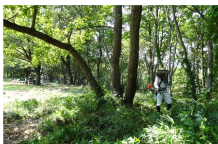
8/18 千畳敷の下草狩り作業