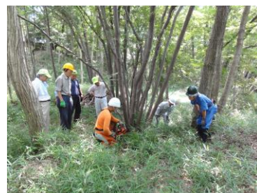
本丸西・出丸で伐倒実技講習