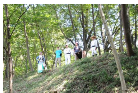
8/18 猛暑の中での作業でした