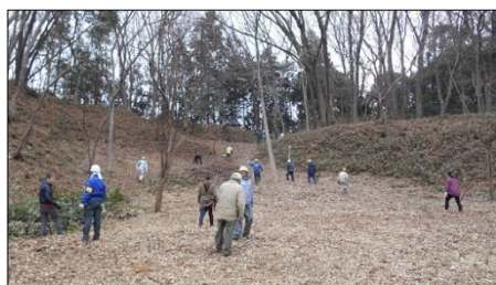
作業後 こんなに綺麗になりました、左が出丸