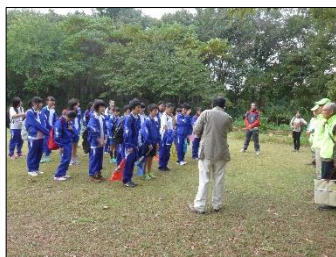
千畳敷で自己紹介をしてから出発

後日、生徒さんから手紙が届きましたのでその一部を紹介します。嬉しいメッセージは今後の活動の励みになりました。