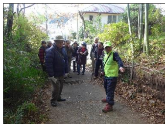
中田氏の熱い説明が更に熱かった！

城に詳しい団体さんに、滝山城を知り尽くした(?)私たちならではの詳しいガイドで案内をしました。