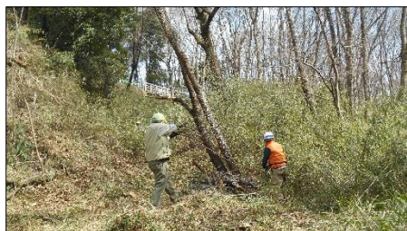
家臣屋敷跡東の橋下から堤防に続く竪堀 作業前

2月の作業で伐採した樹木の片付けと家臣屋敷跡東の橋下から大池堤防に続く竪堀の整備を実施しました。