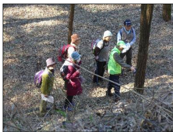
城の話で会話がはずみました