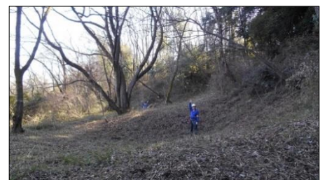
畝状の堀は深いです、人の背丈と比べてください