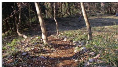
曲輪間の推定通路を造りました