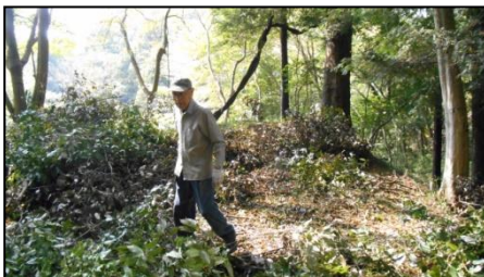
枝は細かく切断してから運びました