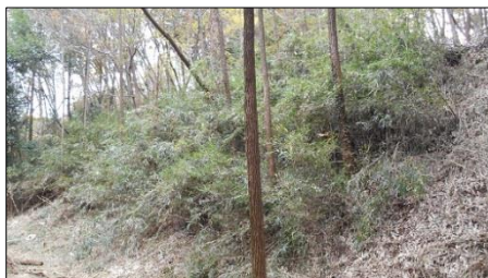
本丸南・腰曲輪二段目の切岸 作業前

本丸南・腰曲輪は以前から継続して整備を行ってきました。三段ある腰曲輪と切岸(斜面)を集中的に整備した事により各曲輪への虎口を狙う櫓台跡の位置関係がよく分かるようになりました。本丸という身近な場所ですが、景観が回復した事により詳しいナワバリの説明が可能になりました。今まで以上に注目したいエリアです。