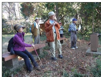
本丸からの眺望を楽しむ参加者