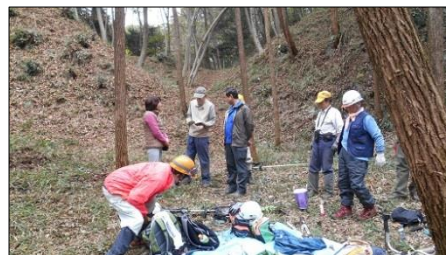
女性会員が応援に駆けつけてくれました