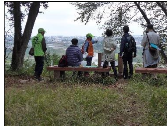
少人数で一体感のある散策でした