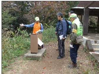
中の丸で多摩川方面の防御の説明

世田谷区から訪れた城好きの方たちと仲間同士のように滝山城を巡りました。少人数のガイド依頼も歓迎です。