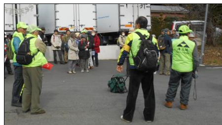
参加会員は帽子と同色のベストを着用しました