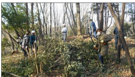
城ガール隊員さんが枝切り鋏で大活躍でした