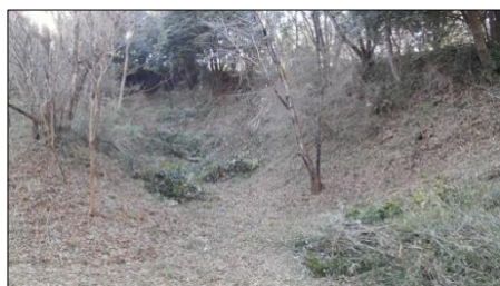
縦堀作業後 同じ場所に見えないほど景観回復