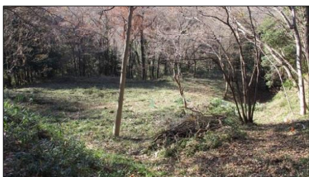
作業後は右側の縦堀もよく見えるようになりました