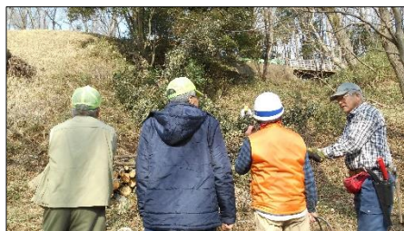
作業成果に満足 次回の作業計画を立てました