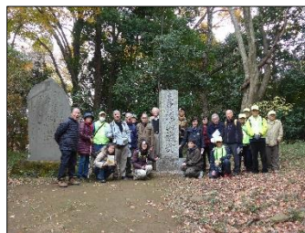
本丸碑の前で登城記念の撮影