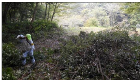
重い丸太は肩に担いで運びました

9 月に伐採し放置してあった樹木の枝などを集積場所に何回も往復して運びました。この日は元八王子で開催された北条氏照祭りに会員 3 名が協力していたこともあり、下草刈り活動はいつもより少ない人数での作業でしたが予定していた作業工程は全て終えることができました。