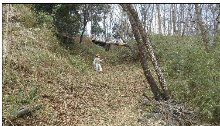
家臣屋敷跡東の橋下から堤防に続く竪堀 作業後