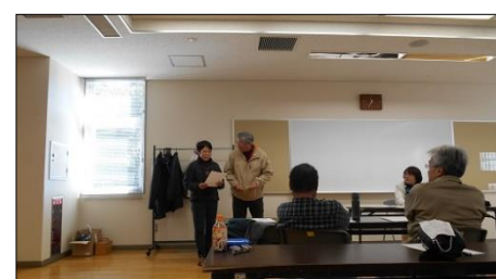
講師はお笑い芸人の「べよん潤」さんでした