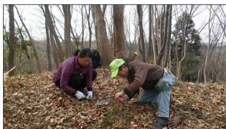
不慣れなボランティアさんに鋸の使い方を指導

12月に続き出丸周辺の整備を行いました。城好きの女子 城ガール隊の2名が参加し、普段より多めの総勢17名で作業を行いましたので作業がはかどりました。この日は参加者たちの動きがいつもより良かった気がしました、なぜ？