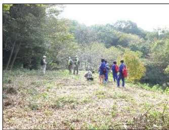
班ごとに城内を巡りました