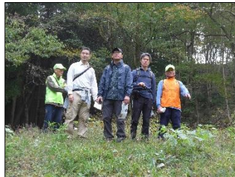
弁天池跡 池に浮かんだ舟を想像中