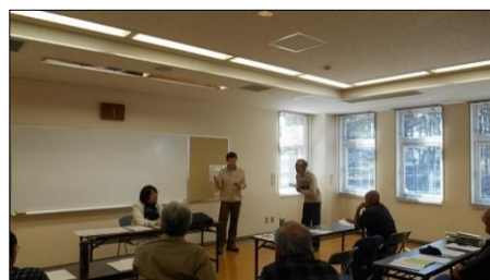
「聴き手を楽しませるガイドの仕方」を受講中