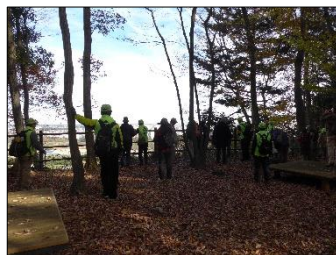
山の神曲輪で城と民衆の関わりの話