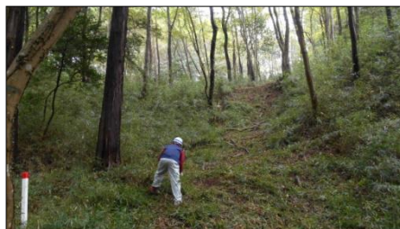
足場の悪い場所での作業もありました