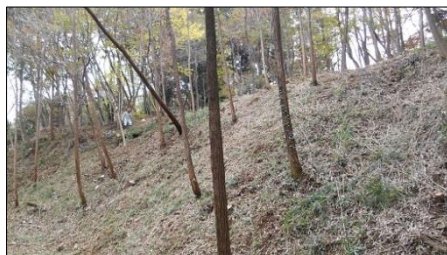
本丸南・腰曲輪二段目の切岸 作業後