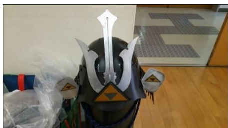
製作途中の兜 独自にアレンジを加えた人もいます

平成27年12月13日から平成28年3月6日の期間5回にわけて、最大22名がボランティアガイド養成講座と甲冑組み立て講座を受講しました。講座は「滝山城跡現地でガイドの基本知識」、「おもてなしの心得」や「聴き手を楽しませるガイドの仕方」などについて学習しました。完成した甲冑は滝山城跡のガイドなどで着用する予定です。