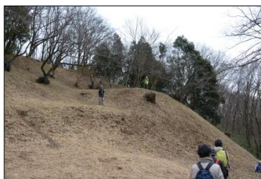
櫓台のことなど城の詳しい説明もしました

「緑の学習講座」というテーマでしたが、滝山城の歴史を知りたいという参加者が多数いらっしゃいましたので、更に滝山城に興味を持って頂けるようなガイドで城の説明をしました。