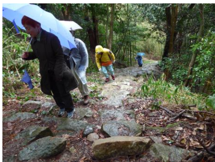
古城址の雰囲気城たっぶりの観音寺城 苔の生えた石段を登ると本丸に辿り着く