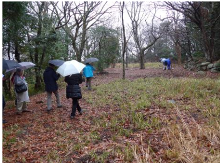
観音寺城は独自の技法で積まれた石垣は見ごたえがありました