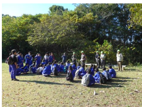
11/7 滝山城跡見学会 (八王子市立加住小中学校・中学部1年生)