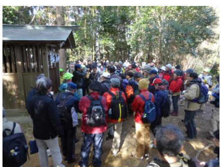
普段は人を見かけない本丸跡ですが当日は参加者で満員になりました