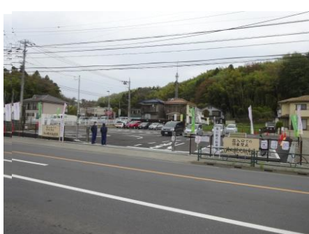
出入口は滝山街道側に面しています