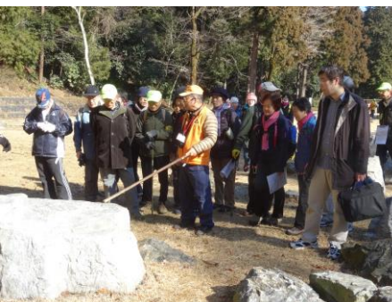
御主殿地区は八王子城跡ボランティアガイドの方々に説明をしていただきました

当日は予想を上回る人数の参加者や出発地点近くで太鼓の練習があるなど想定外の事態がありました。御主殿地区は八王子城跡ボランティアガイドの会の方々に説明をしていただき、御主殿地区から先は本会のガイドによってご案内しました。殿の道や詰の城などの難コースもありましたが全員が無事に踏破しました。