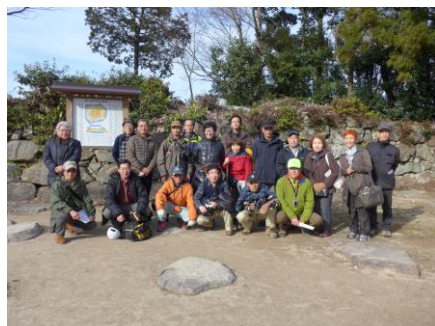
安土城天主での集合写真 会員同士の親睦が更に深まりました