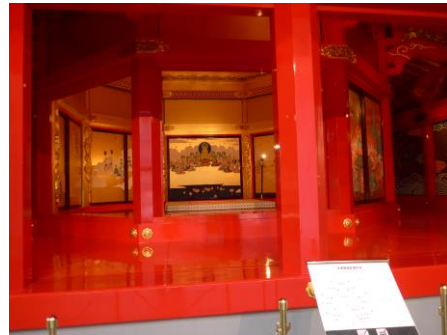
「安土城天主 信長の館」の天主レプリカ は塑像以上の豪華さに驚きました