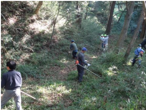
10/19 本丸から弁天池方面へ下る通路の下草刈りを行いました