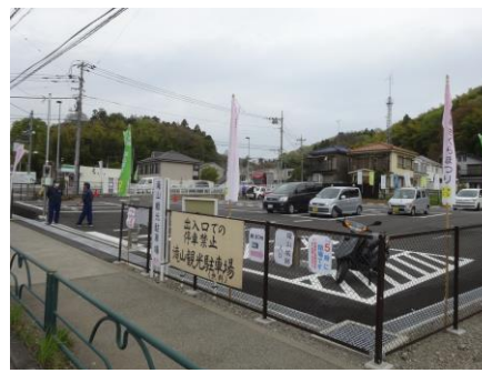
3月22日から利用可能になっています