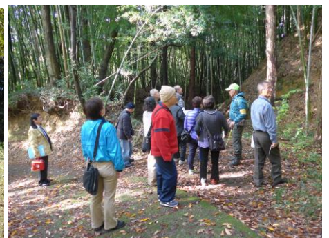
11/21 バスでめぐる施設見学会 (八王子市 総合経営部広聴課)