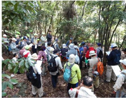
本丸での昼食を終えて山麓の浄福寺へ向かいます