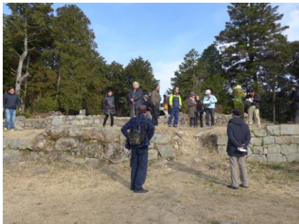
安土城・天主跡は景色がよく、この天主からの眺めは絶景だったろう