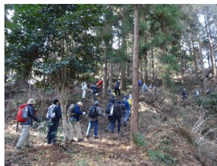
八王子城の特徴の高低差を利用した防御を体感しながら登ります