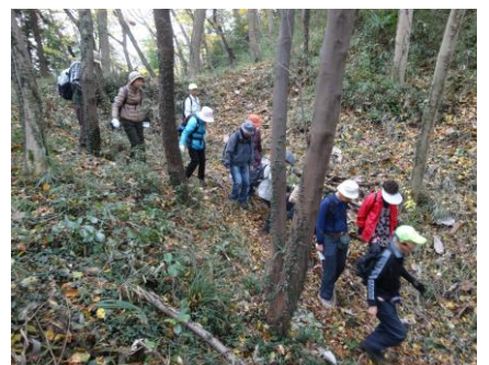
出丸西側の馬出から横堀を下るルートは今回の新しく設定しました