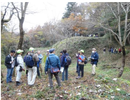
滝山城の見どころのひとつになっている弁天池と弁天島周辺を案内しています