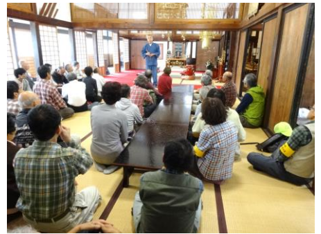
浄福寺本堂内でご住職の楽しいお話を伺いました