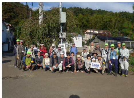
11/3 自然体験講座 (八王子市北部地区環境市民会議)